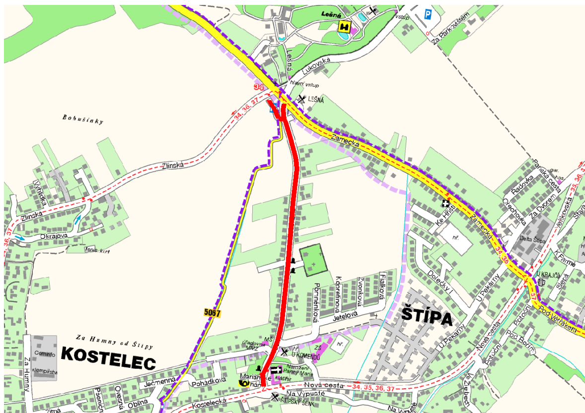
Obr. č. 2: Grafické znázornění oblasti vymezené pod bodem 2)